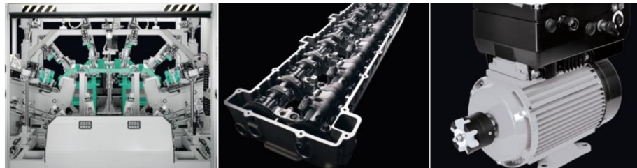
Industrieumsatz 2016: ~255 Mio. EUR Ultrasonic Technology und Powertrain Technology